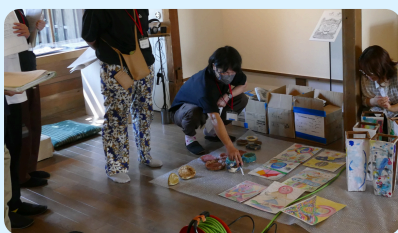
みんなで展示方法を考え