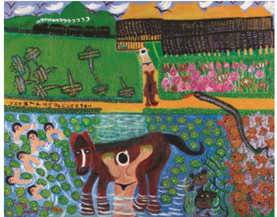
「馬入れ川」 2001年