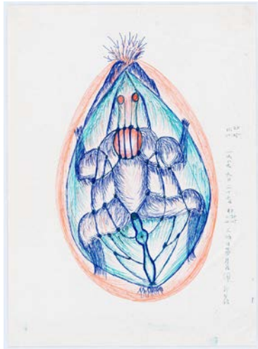
「Meridian Chart of the Dantian 《人体中丹田経絡図》」 1989年